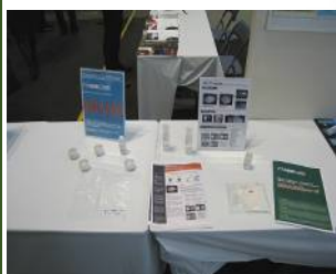
安全な防カビ、防藻剤