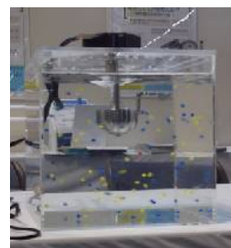
羽根のない攪拌器の実演