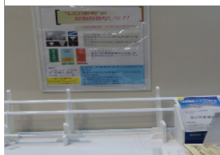
初期投資不要のLED照明