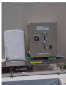
消臭・殺菌、防虫(ねずみ、ゴキブリ)対策に