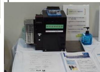
冷凍チャック。凍結切片装置