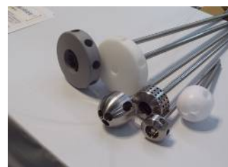
羽根のない攪拌器はH24年度の発明大賞