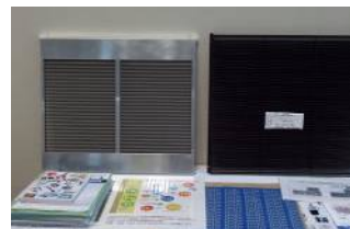
空気触媒。脱臭・抗菌フィルター