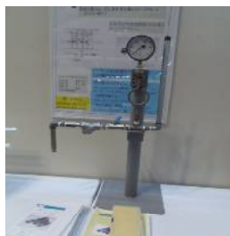
蒸気もれない、故障しない スチームトラップ